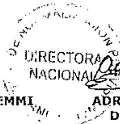
ADRIANA VASQUEZ COUSIN DIRECTORA NACIONAL INSTITUTO DE NORMALIZACION PREVISIONAL